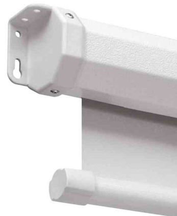
Detailsicht: integrierte Aufhängepunkte rechts und links