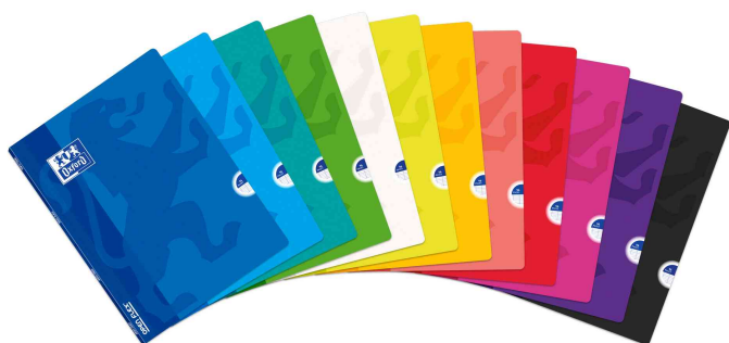
visuel de référence: Cahier "OpenFlex"