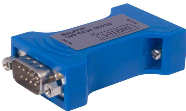
Konverter von RS-232 zu RS-485