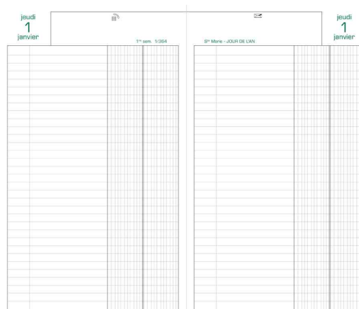
Agenda Banquier large - 280 x 175 mm, grille