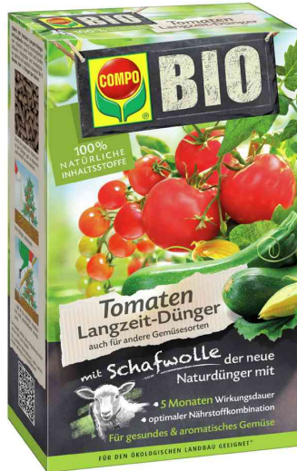
COMPO BIO Tomaten Langzeit-Dünger mit Schafwolle

- für alle Tomatenpflanzen und -sträucher sowie Frucht und Knollen bildendes Feingemüse und Kräuter