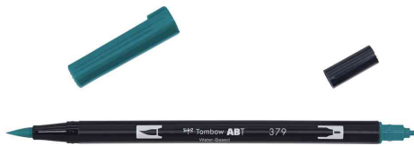
mit 2 Spitzen