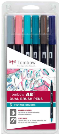
Doppelfasermaler "ABT DUAL BRUSH PEN", 6er-Set Vintage Colours