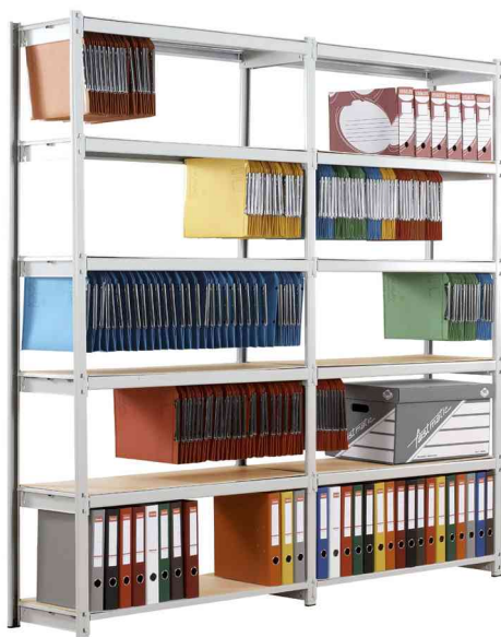
Hängeregistraturregal "RANG' ECO" (Lieferung unbestückt)