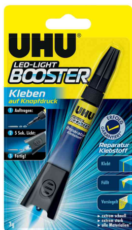
Reparatur-Klebstoff LED-LIGHT BOOSTER, 3 g