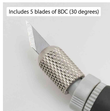
Includes 5 blades of BDC (30 degrees)