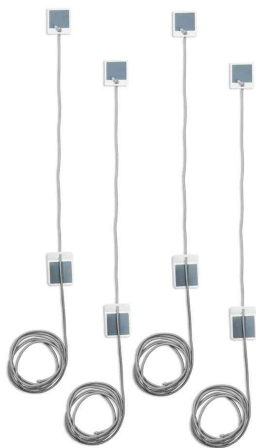
Elastikschnur mit Klebepad Board Lanes