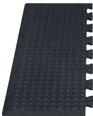
Yoga Flex oil, Endstück