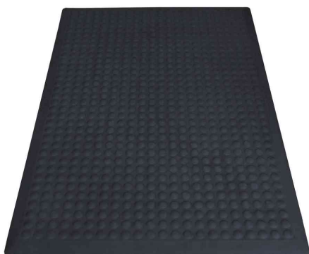
Yoga Flex Oil, Einzelmatte