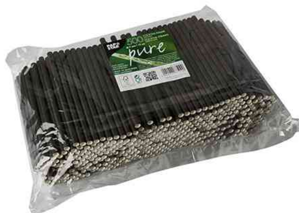
Papier-Trinkhalme "pure", Verpackung