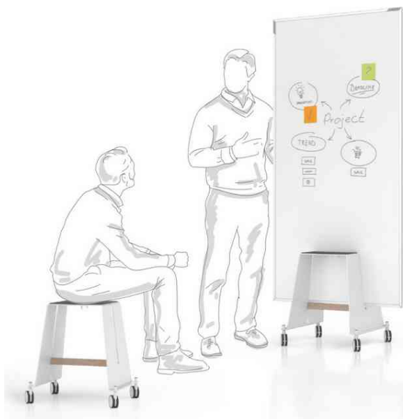
Design-Thinking Base auch als stylischer Hocker nutzbar