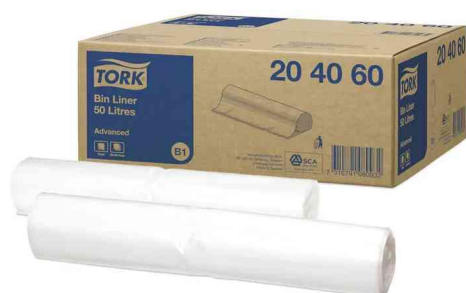
Abfallsack, 50 Liter

Passende TORK Spender mit dem System B1 finden Sie in unserem Webshop!