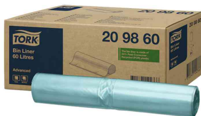
Abfallsack, 60 Liter