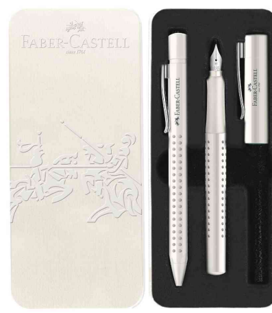
Schreibgeräte-Set GRIP 2010 Harmony, weiß