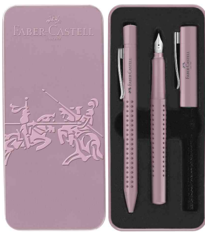
Schreibgeräte-Set GRIP 2010 Harmony, rose