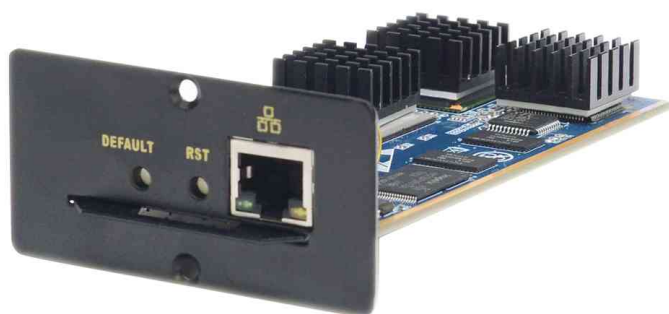
IP-Modul für KVM-Switches