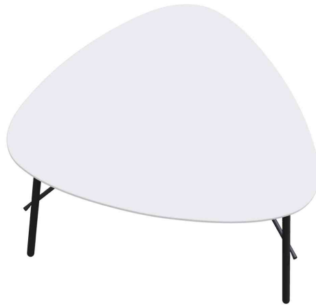
Beistelltisch LAZY, (B)605 x (H)500 mm, weiß