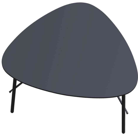
Beistelltisch LAZY, (B)605 x (H)500 mm, schwarz