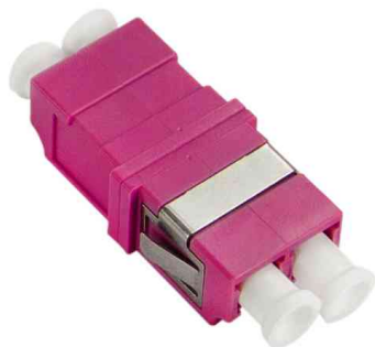
LWL Kupplung, 2x LC-Duplex, Multimode