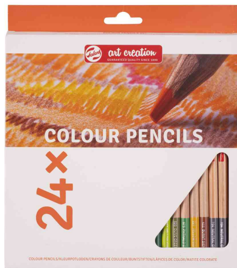
Art Creation Buntstifte, 24er Etui