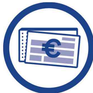
Ihre Vorteile auf einen Blick