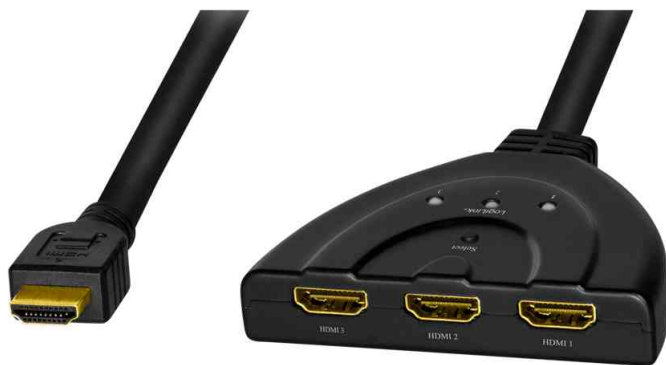
4K/30 Hz HDMI Splitter / Switch, bidirekt, Pigtail, 3-fach

- ermöglicht es bis zu 4 HDMI Bildschirme an nur einem HDMI Anschluss zur gleichen Zeit zu betreiben