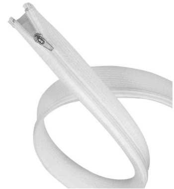
Kabelschlauch mit Reißverschluss, weiß