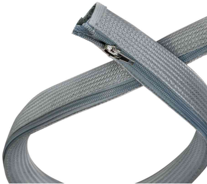
Kabelschlauch mit Reißverschluss, grau

- ideal um Kabel zu bündeln - kein verknoten mehr