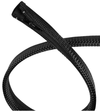
Kabelschlauch mit Reißverschluss, schwarz