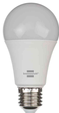
Smarte LED-Lampe SB 800

Anwendungsbeispiele: - für eine smarte Beleuchtung im ganzen Haus