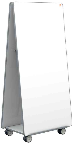
Mobiles Weißwandtafel-System Move & Meet