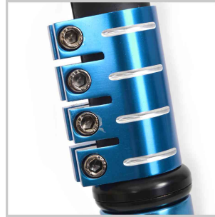
Detail: 4-fach Klemme