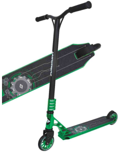
Tretroller Stunt-Scooter "Flipwhip", grün

- bietet technisch eine sensationelle Ausstattung für die Stuntspezialisten im Skatepark und beim Street-Riding