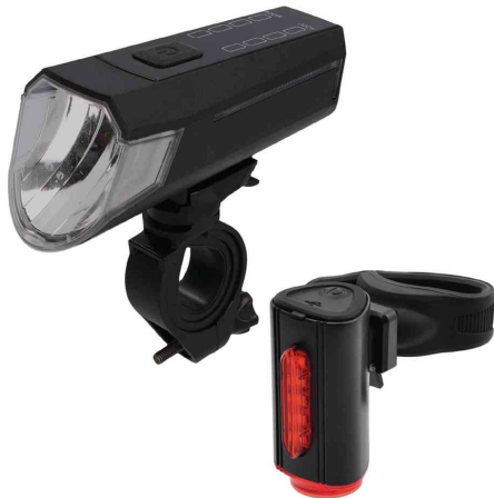
Fahrrad Akku-USB-LED-Beleuchtungs-Set TWIN, 80 Lux