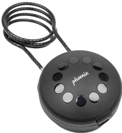
Schlüsselbox PALM KS0212E, mit Stahlkabel