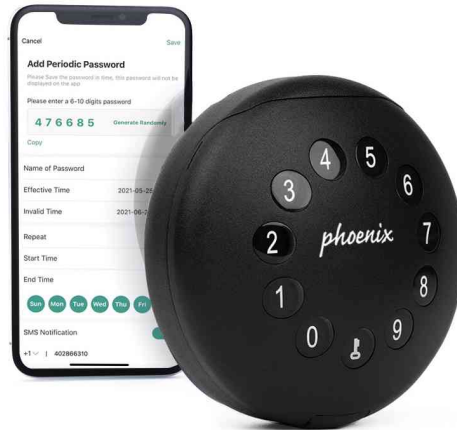
Schlüsselbox PALM KS0212E mit App programmierbar