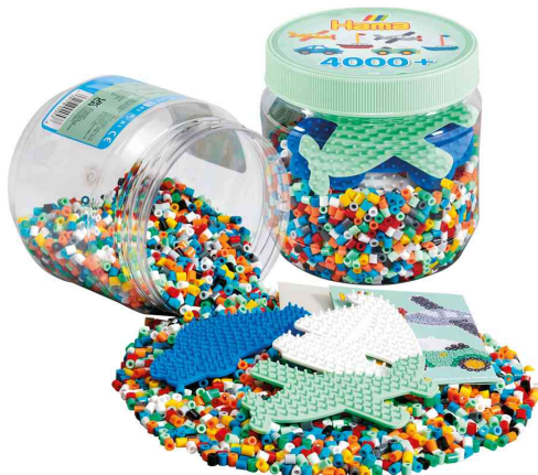
Bügelperlen midi + Stiftplatten, 4.000 Stück in Kunststoffdose

ACHTUNG! Nicht geeignet für Kinder unter 36 Monaten, wegen verschluckbarer Kleinteile.