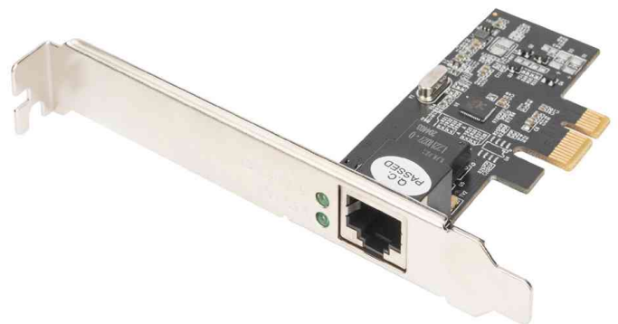
Gigabit Ethernet PCI Express Netzwerkkarte 2,5G