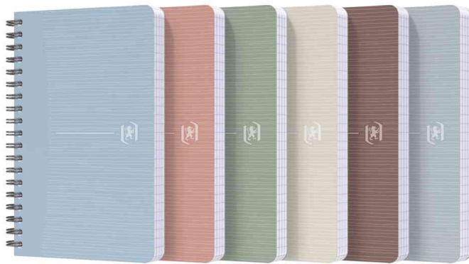
Spiralbuch My Rec'Up

SCRIBZEE® kompatibel: Die kostenlose Cloud-basierte App ermöglicht es, handschriftliche Notizen und Dokumente zu scannen, zu speichern und zu organisieren.