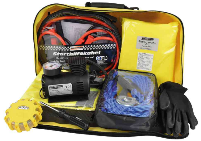
KFZ-Werkzeug & Pannentasche mit Inhalt