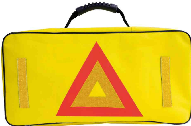
KFZ-Werkzeug & Pannentasche, Rückansicht