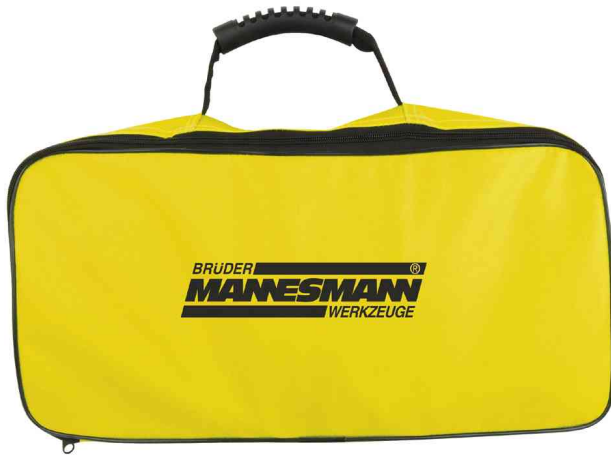
KFZ-Werkzeug & Pannentasche