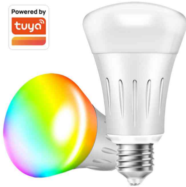
Wi-Fi Smart LED-Lampe R63, Sockel: E27

Anwendungsbeispiele: - um die Kontrolle über die Beleuchtung zu übernehmen und die perfekte Stimmung das Zuhause zu schaffen - zum Ändern der Lichtfarbe und Helligkeit via App