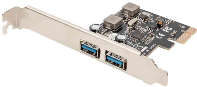
USB 3.0 PCI Express Add-On Karte

- erweitert den PC mit PCIe-Steckplatz um 4 vollwertige USB 3.0 Ports (USB A) mit bis zu 3000 mA