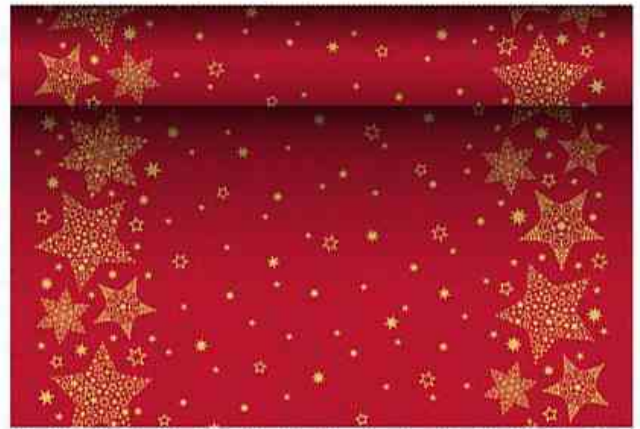
Weihnachts-Tischläufer "Christmas Shine", rot