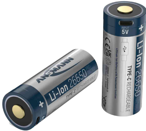
Li-Ion Akku 26650, mit USB-C Kupplung

- ideal geeignet für moderne LED-Taschenlampen, Stirnlampen, Laser-Stifte, E-Zigaretten