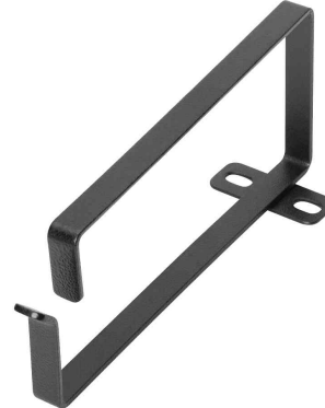
19" Kabelführungsbügel, schwarz