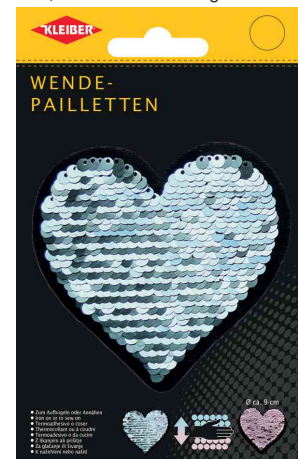
Wendepailletten Herz, türkis-rosa