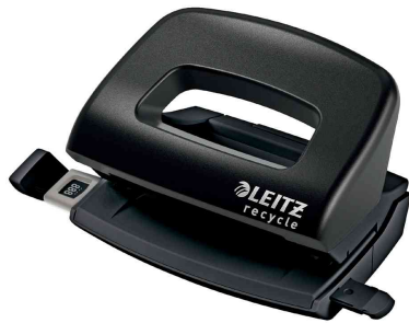
Locher Mini NeXXt Recycle, schwarz