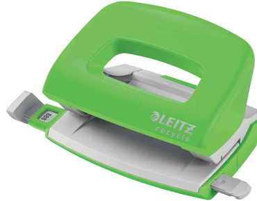
Locher Mini NeXXt Recycle, grün