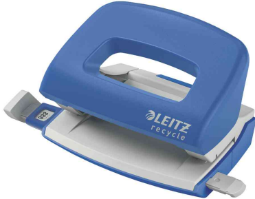
Locher Mini NeXXt Recycle, blau