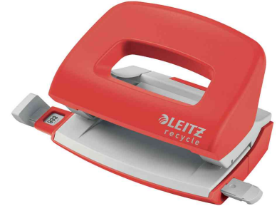
Locher Mini NeXXt Recycle, rot