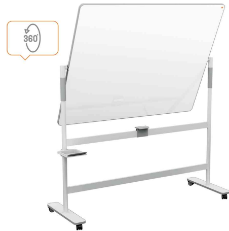
Stativ-Drehtafel Mobil Move & Meet