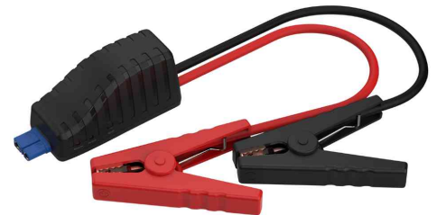
Zubehör: Starthilfekabel (nicht im Lieferumfang)