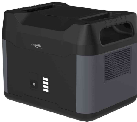
Zubehör: Erweiterungsakku PSE2200 (nicht im Lieferumfang)