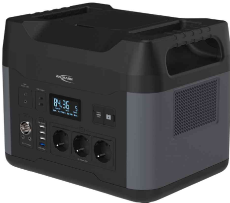
Mobiles Ladegerät / Powerstation PS2200AC