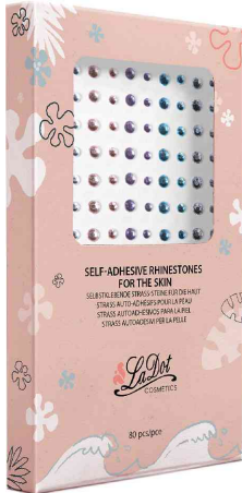
Strass-Steine-Set LaDot LA0003, Verpackung

- zum Dekorieren und Verschönern von LaDot-Tattoos