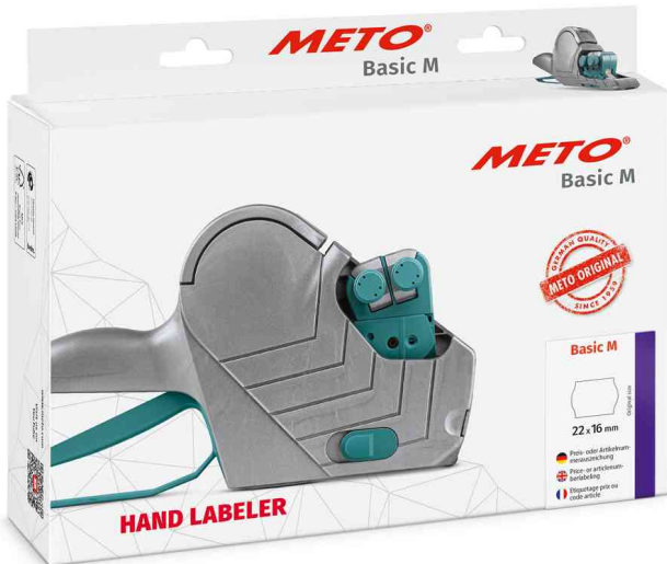
Preisauszeichner Basic M 1622