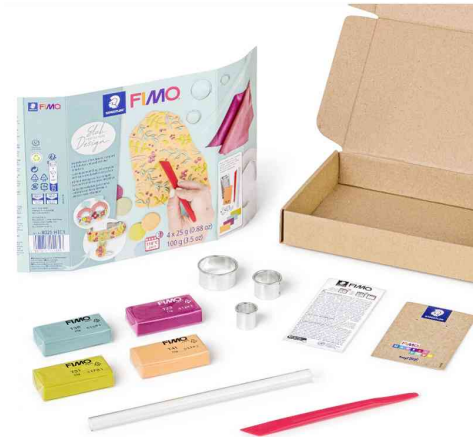
Modelliermasse-Set SOFT Slab-Design, Inhalt