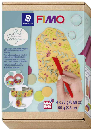
Modelliermasse-Set SOFT Slab-Design