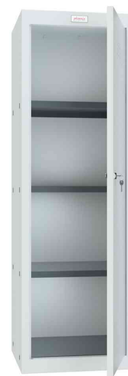
Würfel-Schließfach CL1244, hellgrau