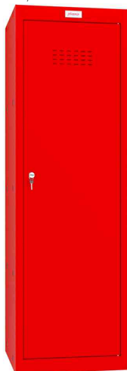
Würfel-Schließfach CL1244, rot