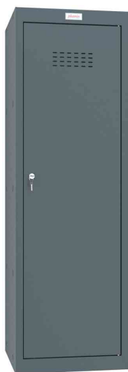
Würfel-Schließfach CL1244, anthrazit