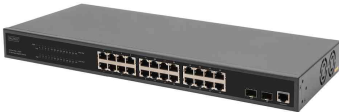
19" Gigabit PoE Switch

Lieferumfang: Switch, Netzkabel, DB9 auf RJ45 Kabel, Rack-Montage-Kit, 4 GummifüÙe und Anleitung