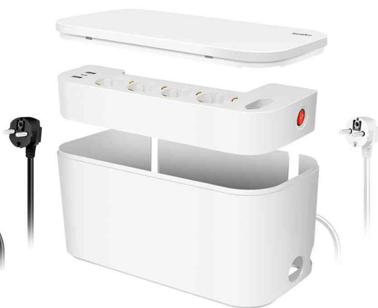
Kabelbox mit Steckdosenleiste, weiß