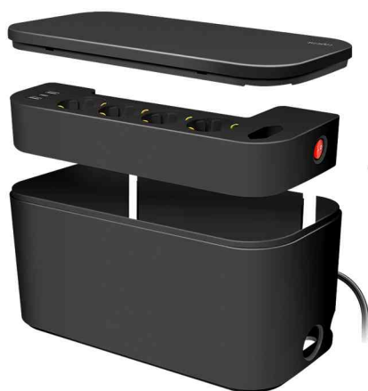
Kabelbox mit Steckdosenleiste, schwarz