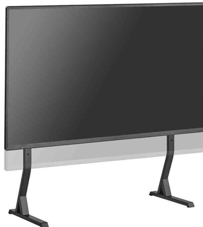
TV-Ständer, Höhe einstellbar