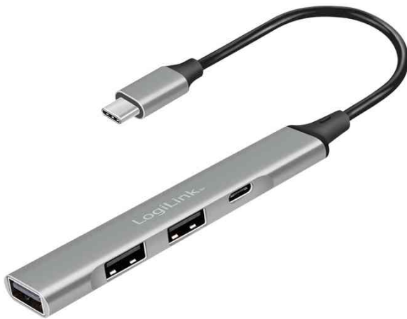
USB 3.2 Gen1 Hub, 4 Port