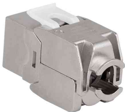
Keystone Verbinder Kat.6A