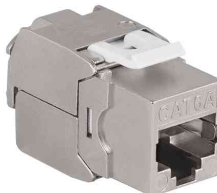
Keystone Verbinder Kat.6A