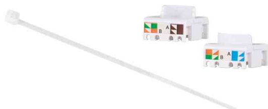
Keystone Verbinder Kat.6A