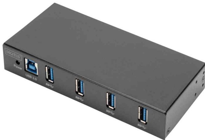
USB 3.0 Hub Industrial Line